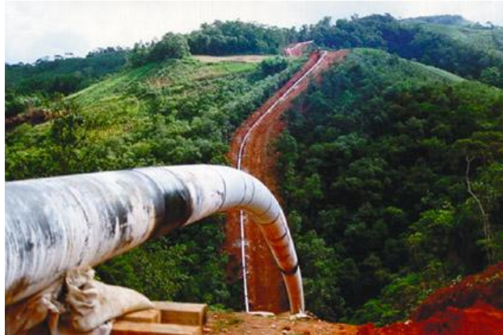
Figura 1 – Implantação de dutos